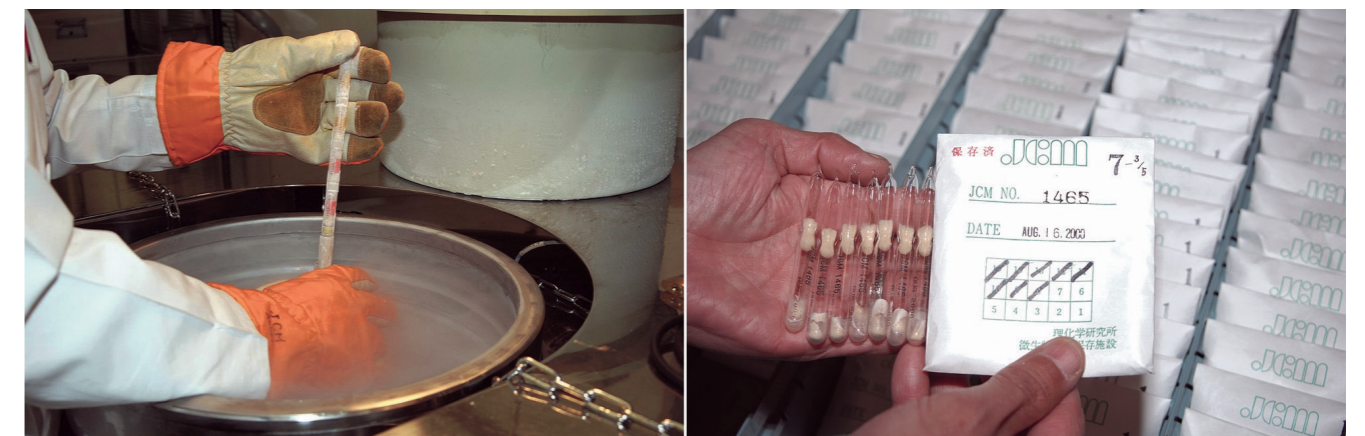
Fig. 1 Left, Preservation of microbial cultures in liquid nitrogen tank. Right, Ampoules of freeze-dried microbial cultures used for distributions.